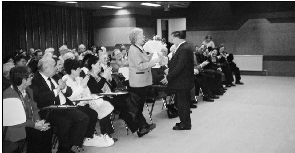
V nabito polni dvorani na občnem zboru KO DIS Ljubljana Bežigrad so se udeleženci seznanili s številnimi aktivnostmi v minulem letu in sprejeli program za tekoče leto. (11. 2. 2006)