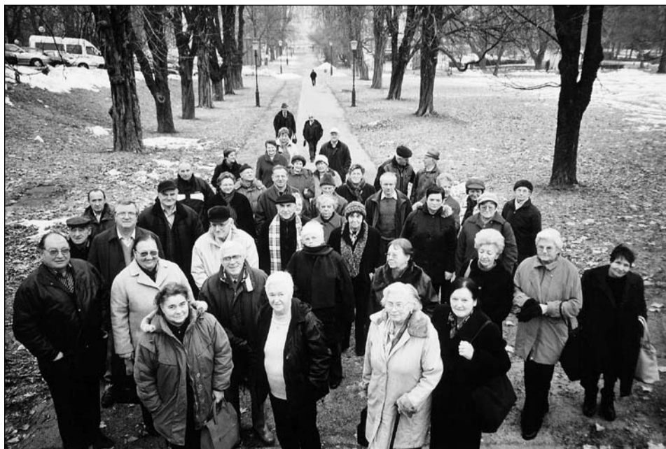
Del udeležencev iz Krajevne organizacije DIS Novo mesto ob prihodu na razstavo o izgonu Slovencev 1941–1945 v Muzeju novejšje zgodovine v Ljubljani, 22. decembra 2005.

Torej izgnancem tudi v prihodnje ne bo treba plačevati premije, saj bo to obveznost poravnala država iz proračuna.