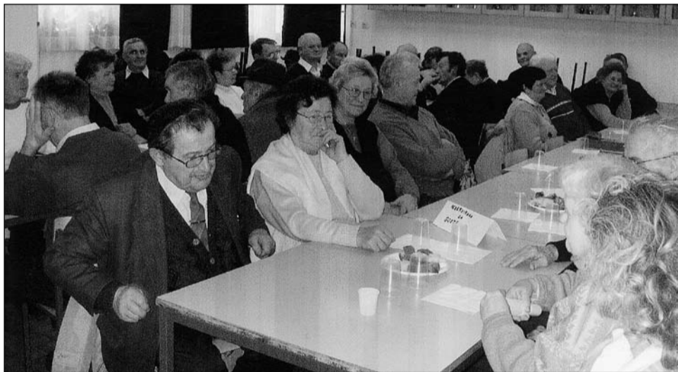
Del udeležencev na občnem zboru KO DIS Dole pri Litiji, 29. 1. 2006