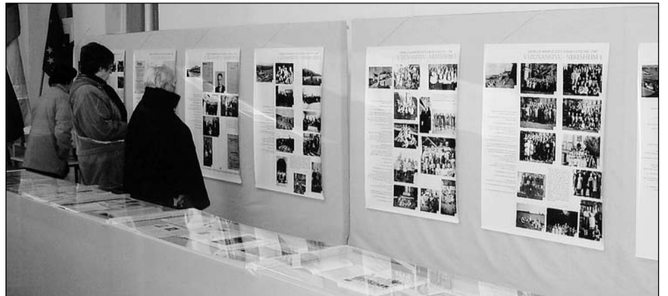
V spomin in opomin - stalna razstava Krmelj in Krmeljčani v vojnih letih 1941-1945 je bila odprta 26. 11. 2005.