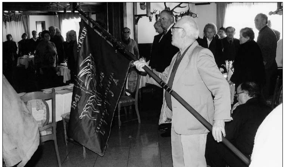
V KO DIS Litija so 15. 12. 2005 razvili prapor.