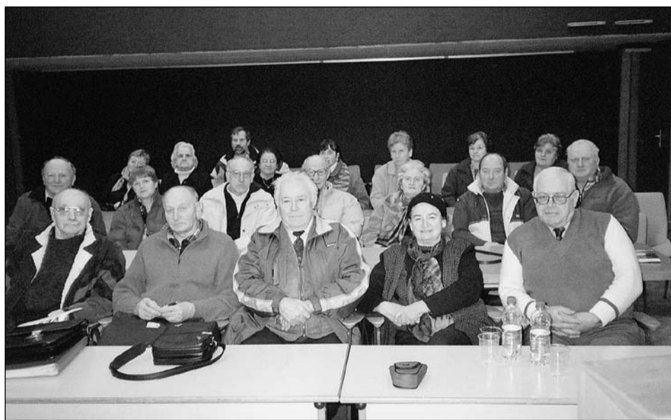
Del udeležencev in gostov občnega zbora KO DIS Cerknica - Logatec. (21. 01. 2006)