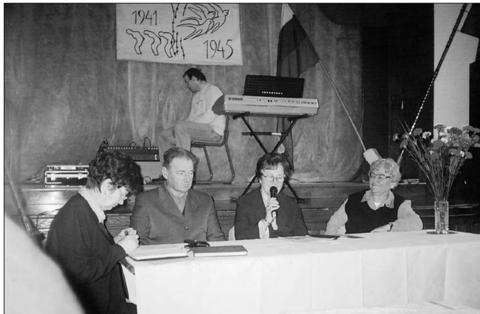
Delovno predsedstvo na občnem zboru KO DIS Globoko - Pišece 28. 1. 2006