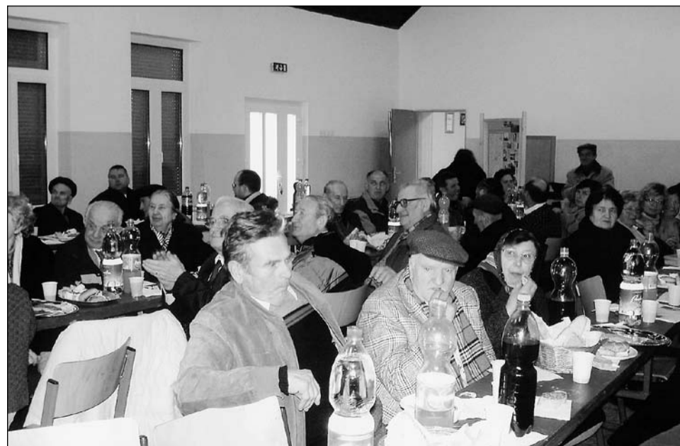
Na občnem zboru KO DIS Bučka so se zbrali skoraj vsi člani te organizacije in svojci. (14. 1. 2006)