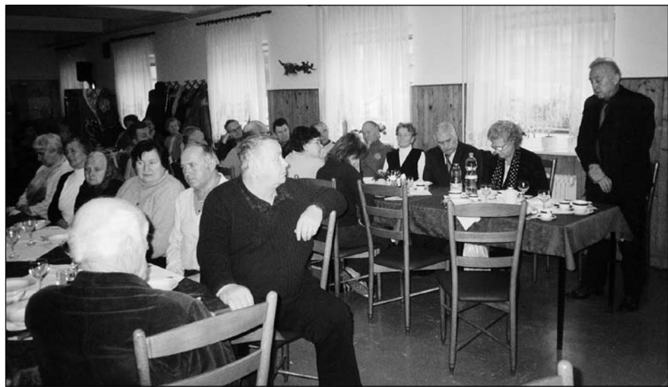
Del udeležencev na občnem zboru KO DIS Trebnje