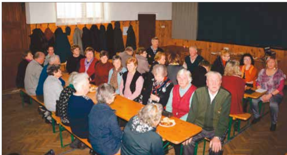
Občni zbor članov DIS Dole pri Litiji