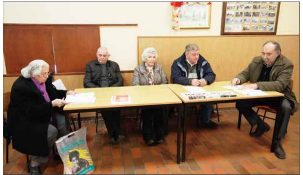
Delovno predsedstvo KO DIS Polje ob Sotli 25. 1. 2020

Ker v KO DIS Polje ob Sotli dolgo niso sklicali občnega zbora in ker je dosednji predsednik KO DIS v domu za starejše, je Društvo izgnancev Slovenije 1941-1945 sklicalo vse člane DIS Polje ob Sotli na sestanek, ki je bil 25. januarja 2020 v gasilnem domu v Polju ob Sotli. Na sestanek je prišlo veliko članov DIS, ki jih zanimajo vprašanja ohranitve pravic, vrnitve klimatskega zdravljenja in napor DIS, da bi se dosegli povrnitev vsaj simbolične vojne škode za gmotno škodo, ki je nastala med drugo svetovno vojno.