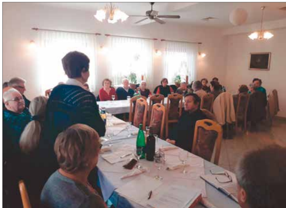
Občni zbor KO DIS Kapele 31. 1. 2020

Krajevni odbor izgnancev Kapele je dne 31. januarja 2020 opravil redni letni občni zbor KO DIS v gostišču Erban v Župelevcu. Poleg članov so se zbora udeležili tudi predstavniki sosednjih KO DIS iz Artič, Brežic, Dobove in KO Globoko - Pišce. V razpravo so se vključili tako člani kakor tudi povabljeni gosti. Skupna ugotovitev je bila ta, da se predsedniki krajevnih organizacij z županom občine Brežice dogovorijo o morebitnem lažjem pridobivanju sredstev za delovanje. Člani so namreč vsako