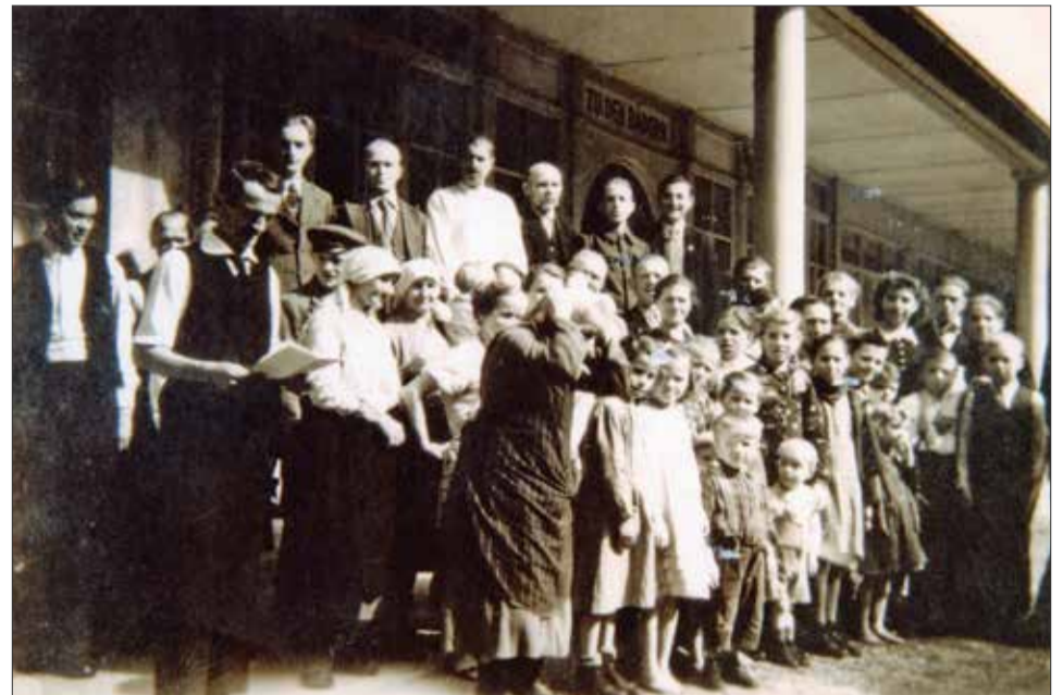
Slovenski izgnanci takoj po prihodu v Wershofen. Čeprav izmučeni, lačni in prestrašeni, smo morali biti na ukaz nasmejani, ko so nas fotografirali. To je bil del lažne propagande, s katero so zavajali nemško prebivalstvo.

Tako smo živeli dve leti, potem so nas premestili v Kochel am See. Hiša, v kateri smo bivali, je bila obdana z žico, ki je bila pod električno napetostjo, da nismo mogli pobegniti. Spomnim se velikega jezera in samih gozdov, vsepovsod samo jezero in nebo. Na nas, otroke, je pazila dolgolasa arijska svetlolaska, hčerka poveljnika taborišča. Včasih smo otroci z njo lahko odšli na drugo stran žičnate ograje, kjer smo se igrali v gozdu. Lovci so imeli tam veliko ogrado z meter in pol visoko ograjo, kamor so zganjali divje prašiče. Ko so že bili zajeti v ogradi, so jih SS-ovci hodili streljati za zabavo. Toda SS-ovci so imeli še druge načrte za zabavo - divje prašiče v ogradi so hoteli hraniti z otroki izgnancev. Vsaj lovci so takrat pokazali toliko človečnosti, da v ogrado niso več naganjali divjih prašičev za SS-ovce.