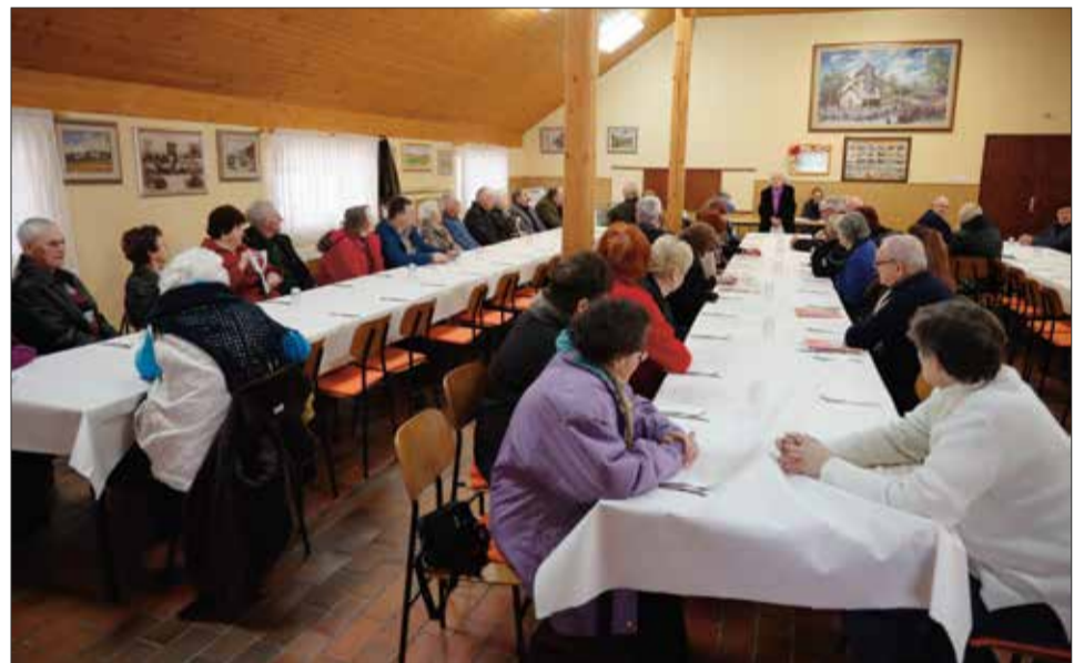
Udeleženci občnega zbora KO DIS Polje ob Sotli 25. 1. 2020