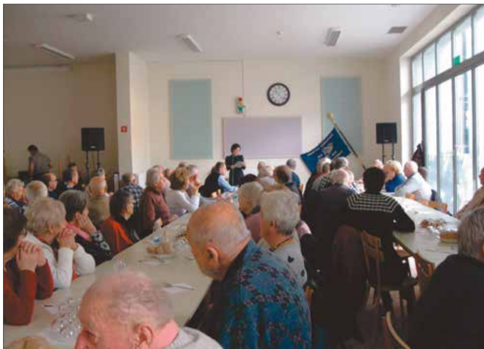
Občni zbor KO DIS Radeče 7. 12. 2019

7. decembra 2019 je bil v prostorih OŠ Marjana Nemca v Radečah volilni občni zbor KO DIS Radeče, katerega se je udeležilo veliko članov, saj so želeli med drugim izvedeti kaj več o sprejemanju novega predloga Zakona o poplačilu gmotne vojne škode.