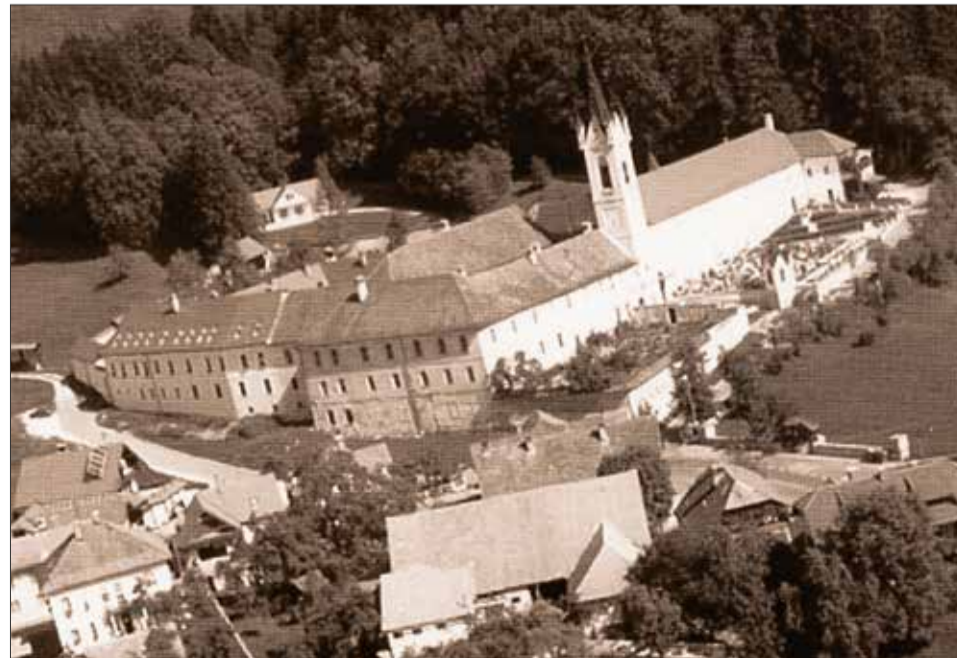
Uršulinski samostan v Mekinjah pri Kamniku je bil leta 1945 repatriacijski center za slovenske izgnance in druge žrtve vojnega nasilja.

Odsek Štaba za repatriacijo za Primorsko je bil odgovoren za baze in sprejemališča v Postojni, Šempetru na Krasu, Tolminu, Vipavi, Ilirski Bistrici, Divači (prej Kozini), Vrhopolju, Ajdovščini, Idriji, Kobaridu, Gorici, Bovcu, Logatcu, Planini, Rakeku, Rajblju in San Bartolomeu pri Trstu.