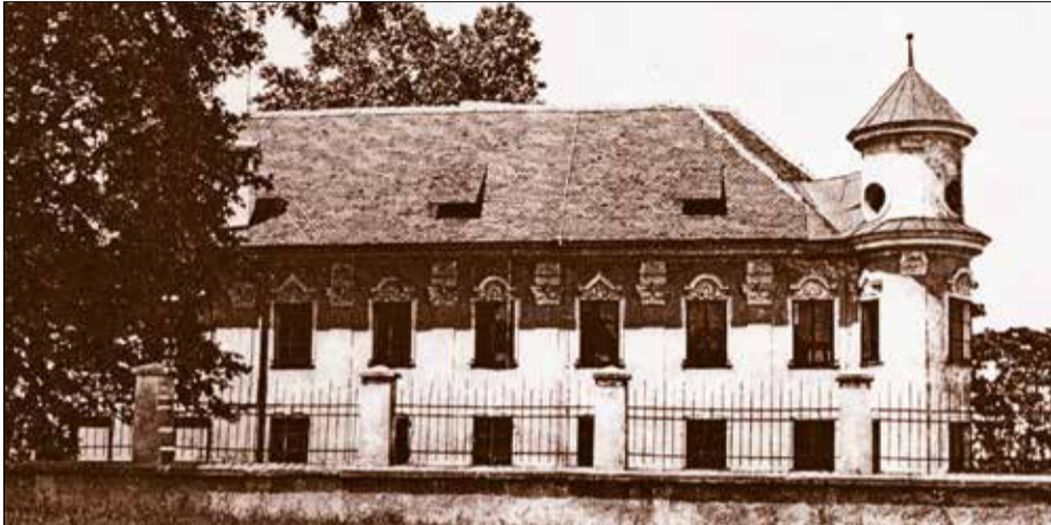
Grad Goričane, kjer je bilo zbirno taborišče za izgon Slovencev iz Gorenjske v Nemčijo.