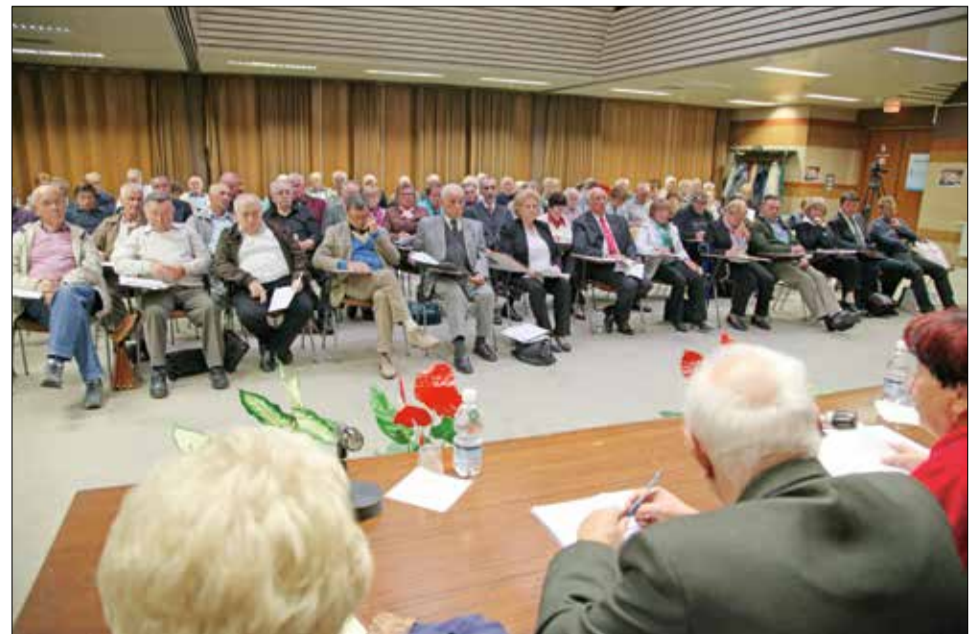
Udeleženci skupščine DIS, 3. oktobra 2015.

Seveda spremljamo tudi problematiko begunstva. Verjetno bi tudi mi kot žrtve vojne lahko pozvali naše poslance v Evropski uniji, da naj vplivajo, da se nasilje in vojne ustavijo, da bo beguncev manj v Evropi. Pobili so nekatere vladarje zaradi uvedbe demokracije, rezultat pa je 50 milijonov beguncev na svetu.