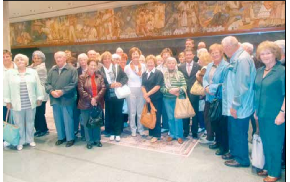
Člani DIS iz Brežic so si ogledali freske v predverju velike dvorane Državnega zbora