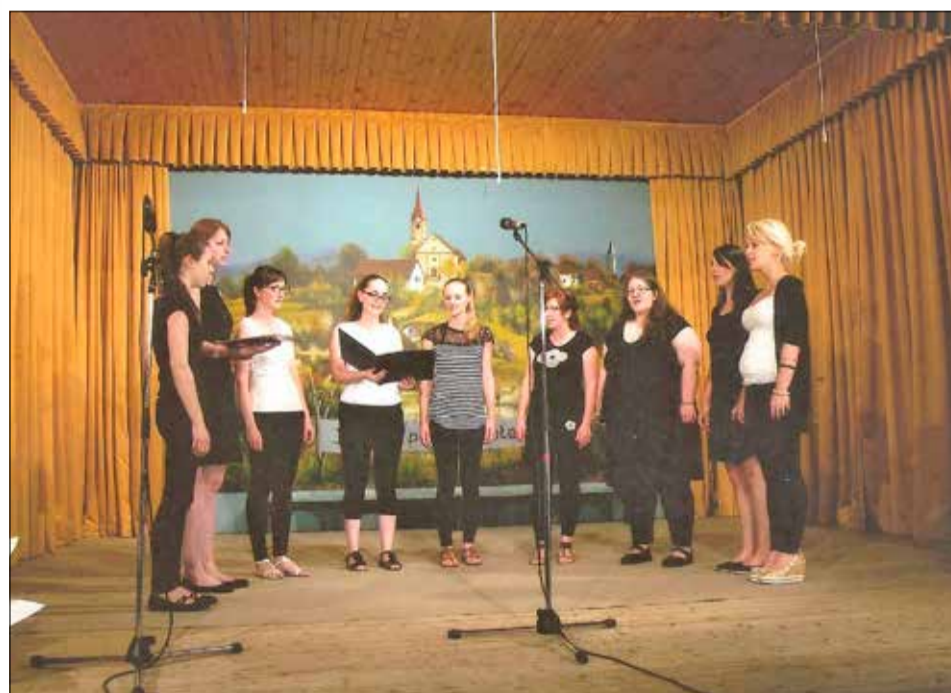
Na prireditvi je nastopila tudi dekliska lokalna skupina Mesečina.