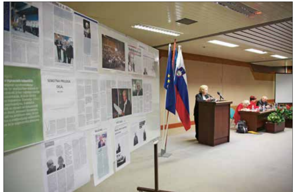
Delegati so si lahko ogledali tudi razstavo o daljših reportažah o DIS v časopisih in revijah.

Izdali smo plakat za pohod od Telč do Bučke in prireditev na Bučki.