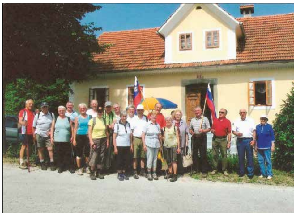
Pohodniki ob nemško-italijanski okupacijski meji od Telč do Bučke so si ogledali tudi rojstno hišo Žnidaršičevih na Bučki.