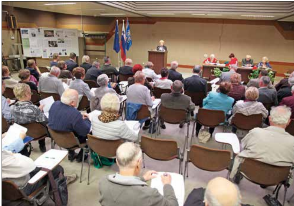
Na seji skupščine DIS 3. oktobra 2015 je bilo več kot sto povabljenih delegatov KO DIS in članov organov Skupščine DIS.