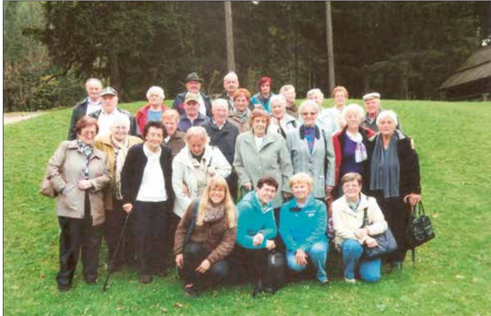
Del udeležencev izleta na Jezerskem, manjkajoči še občudujejo Planšarsko jezero.