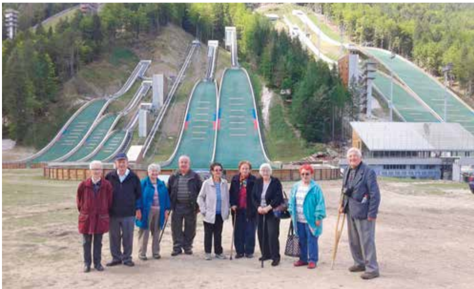
Med ogledom Planice

V sredo, 9. septembra 2015, smo za člane DIS organizirali izlet v Zgornjesavsko dolino. Udeležilo se ga je preko 70 članov. Glede na tako veliko število udeležencev smo najeli dva avtobusa, ki sta jih pripeljala iz Selške in Poljanske doline in v Škofjo Loko pobrala še ostale udeležence izleta.