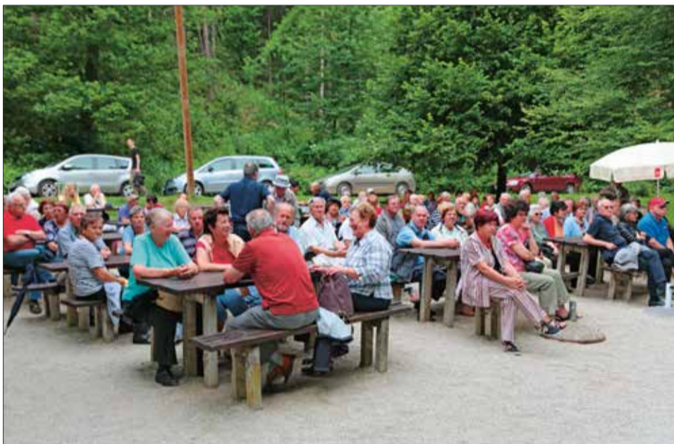
Udeleženci prireditve 6. junija 2017 v parku Mostec v Ljubljani

Vsodelovanju z Izvršnim odborom DIS so krajevne organizacije ljubljanskega območja dan pred dnevom izgnancev, 6. junija 2017, v parku Mostec organizirali prireditev in druženje.