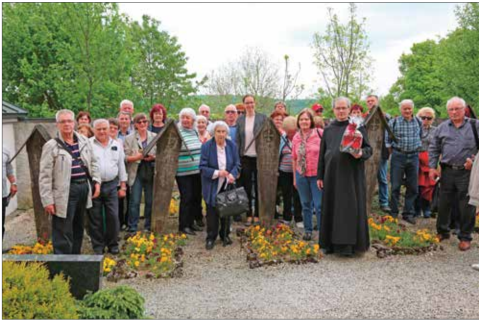
Neresheim – Pokopališče.

vneprej dogovorjenega nemškega vodiča, ki nas je popeljal po mestu, pokazal vse znamenitosti in tudi povedal kaj o kraju. Tokrat pa tega ni bilo. Odslej moramo imeti na izletih vodiča, in sicer vodiča z licenco in ga drago plačati. Doslej smo te izlete vodili sami in zastonj. Predlagam, da bi take izlete vseeno organizirali tudi v prihodnje. Zanamci morajo to gojiti še naprej, da spominjamo Nemce, da ne bodo pozabili na izgon Slovencev.