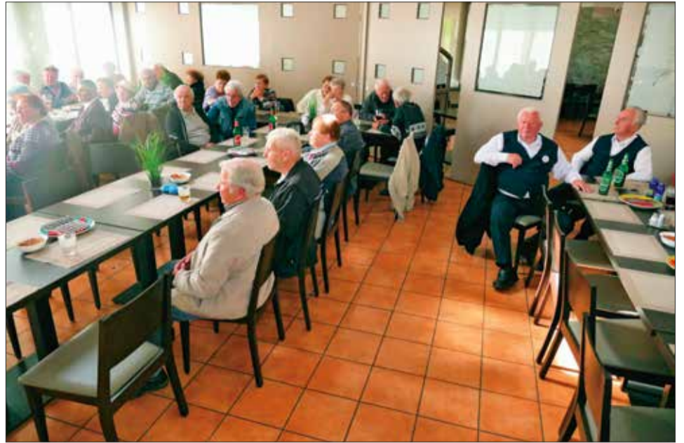
Del udeležencev občega zbora KO DIS Radovljica

problematiko izgnanstva se ni ukvarjala nobena prejšnja niti sedanja oblast. Zato za vse tiste, ki smo preživeli ta nečloveški in nepojmljivi čas, pomeni srečanje na občnih zbora ali skupnih srečanjih vseh 84 KO DIS, prisrčno snidenje in iskreno druženje. Obudijo se spomini, dogodki in obrazi. Tisti vojni čas nas je zaznamoval za vse življenje.