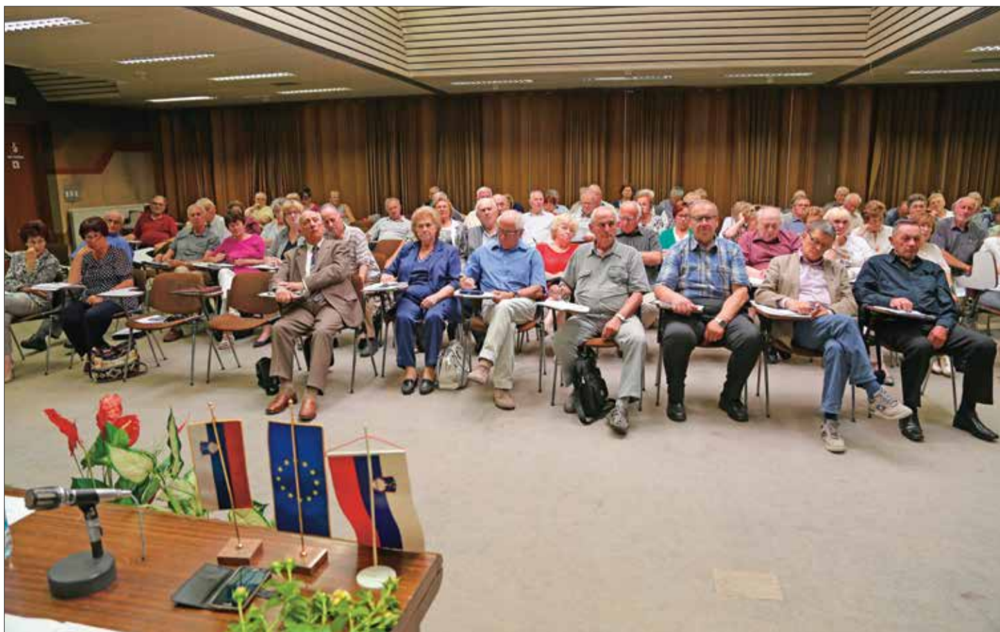
Udeleženci Skupščine DIS, 30. junija 2017

Za skupščino DIS so se opravičili delegati iz Celja, Branika, Velikega Trna, Velenja, Murske Sobote, Petišovcev, Globoko-Pišce, Gornje Radgone, Laškega in Šentjurja pri Celju.