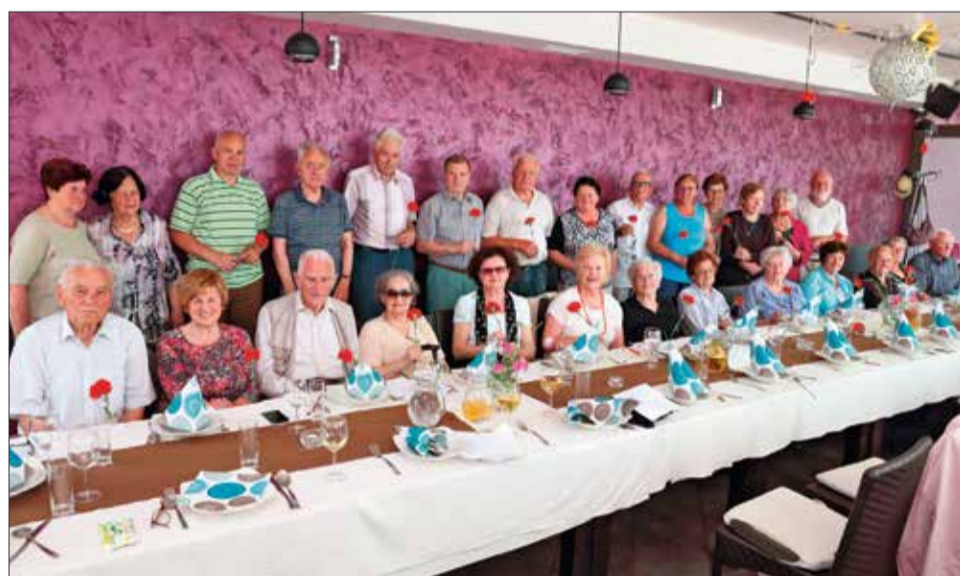
Občni zbor KO DIS Ptuj 6. junija 2017

K rajevna organizacija DIS Ptuj je pripravila letni občni zbor 6. junija 2017.