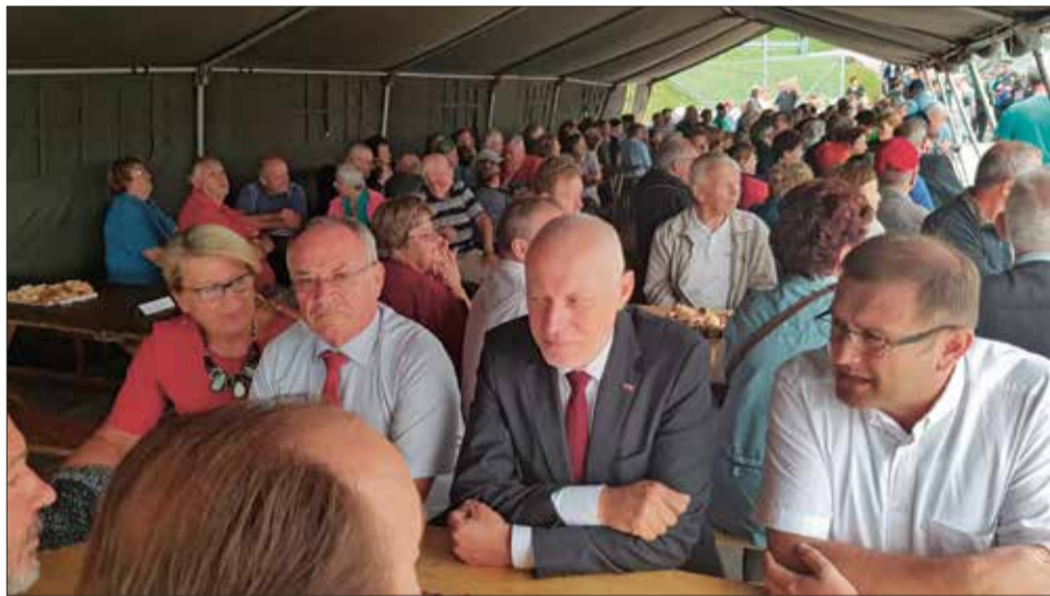
Slavnostni govornik je bil dr. Milan Brglez, predsednik Državnega zbora RS