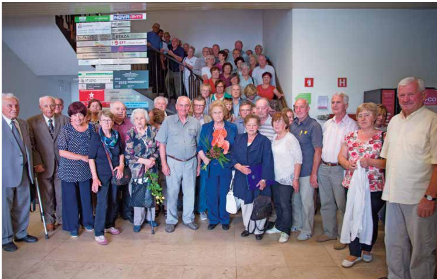
Del udeležencev na skupščini Društva izgnancev Slovenije 1941–1945, 30. junija 2017