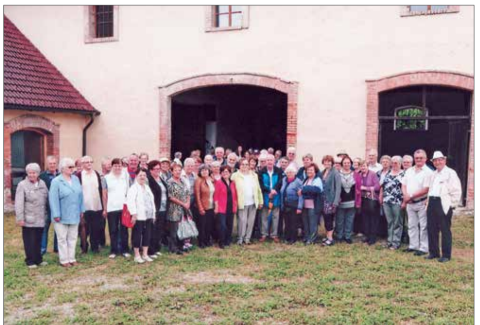
Člani KO DIS Cerklje ob Krki so obiskali zbirno taborišče za izgon Slovencev v Brestanici 7. junija 2017 – na dan odprtih vrat.