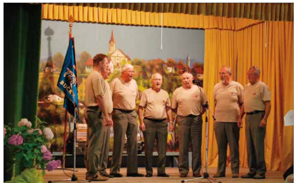
Pevci Fantje z vasi so na prireditvi na Bučki ustvarjali prijetno vzdušje, 1. junij 2017