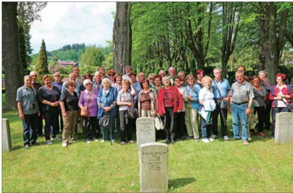
Immenau - ti kamni so za umrle slovenske izgnance postavljeni na našo zahtevo. Izletniki DIS 23. 5. 2017.