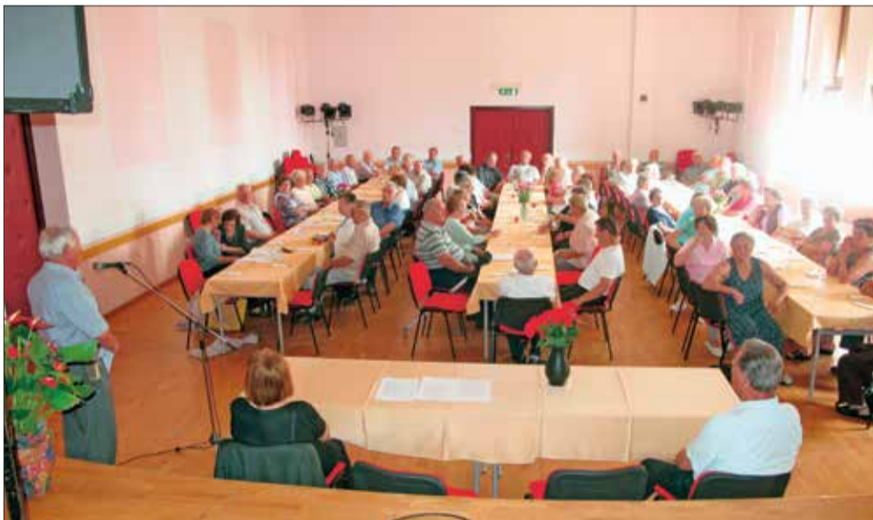
Občni zbor KO DIS Boštanj, 3. junij 2017

Izgnanci KO DIS Boštanj smo se 3. junija 2017 zbrali na letnem zboru. Kljub visoki starosti članov so se zbora udeležili v velikem številu. Veliko jim pomeni druženje, hkrati pa tudi priznanje društvu za pridobljene pravice izgancem in beguncem, saj brez društva pridobljenih pravic ne bi imeli.