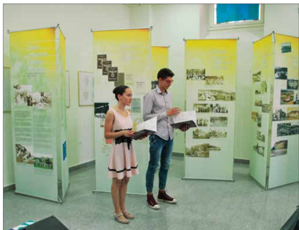
Razstava Društva izgnancev Slovenije o izgonu Slovencev in nasilju nad drugimi slovanskimi narodi na gimnaziji v Brežicah (9. junij 2017)

Gimnazija Brežice, ki je sicer locirana na Trgu izgnancev, je letošnje šolsko leto v okviru Unescovega projekta in pouka zgodovine posvetila slovenskim izgnancem od leta 1941 do 1945. Z omenjenim projektom želijo ohraniti dejaven spomin na pomen dogodkov iz 2. sv. vojne, izgon iz domovine, nasilno potujčevanje in etnocid.