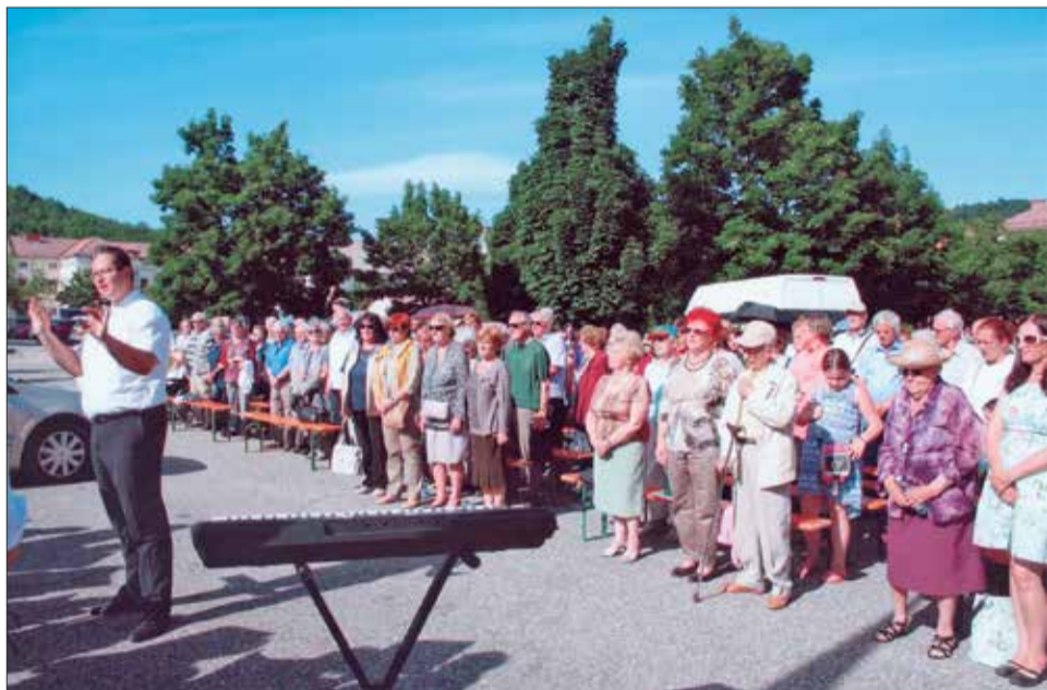
Prireditev DIS ob Meljski kasarni v Mariboru ob dnevu izgnancev