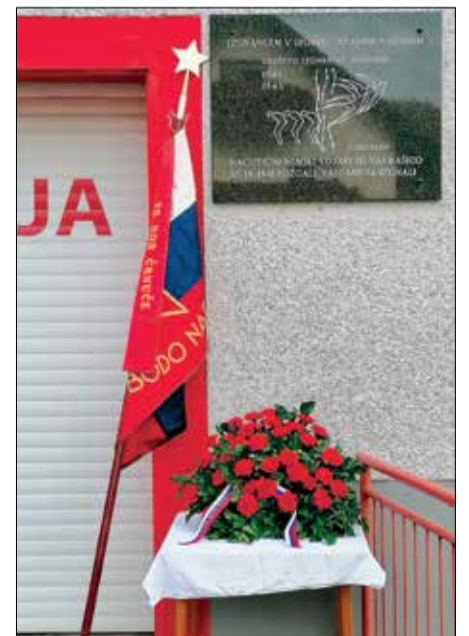
Plošča DIS na Rašici