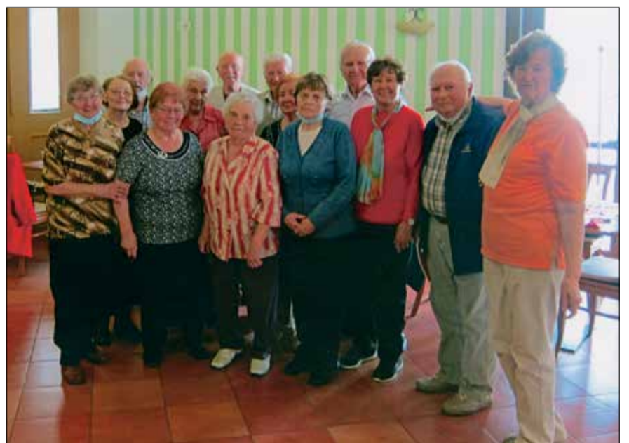
Sestanek odbora članov KO DIS Velenje