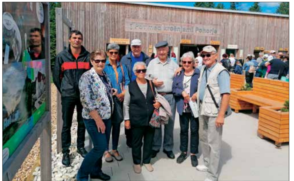
Udeleženci zleta na Roglo, 6. 8. 2021

Člani OO DIS 1941–1945 občin Muta, Podvelka, Radlje ob Dravi, Ribnica na Pohorju in Vuzenica smo si 6. avgusta 2021 ogledali znamenito turistično točko »Pohod med krošnjami Pohorje« na Rogli. Na sprehodu po tej 1034 metrov dolgi leseni poti na 37 m višine nad zemljo in med drevesi smo občudovali veličino pohorskih gozdov in s pogledi v daljavo prepoznavali bližnja in daljna gorovja, kraje in uživali ob žvrgolenju ptic. To je bil balzam za nas starejše. Imeli smo tudi srečo,