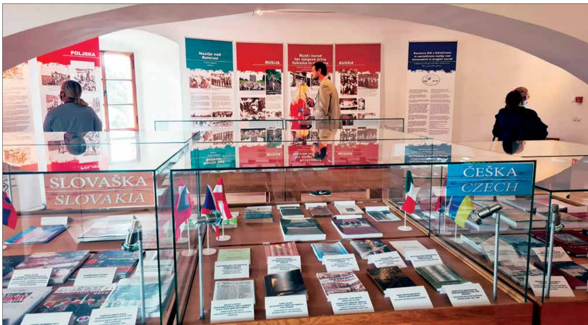
Na razstavi je 20 panojev. Preko 80 publikacij pa je v vitrinah.

D ruštvo izgnancev Slovenije 1941–1945 je pripravilo to razstavo kot zamelek Evropskega muzeja o fašističnem in nacističnem nasilju nad slovanskimi in drugimi narodi.