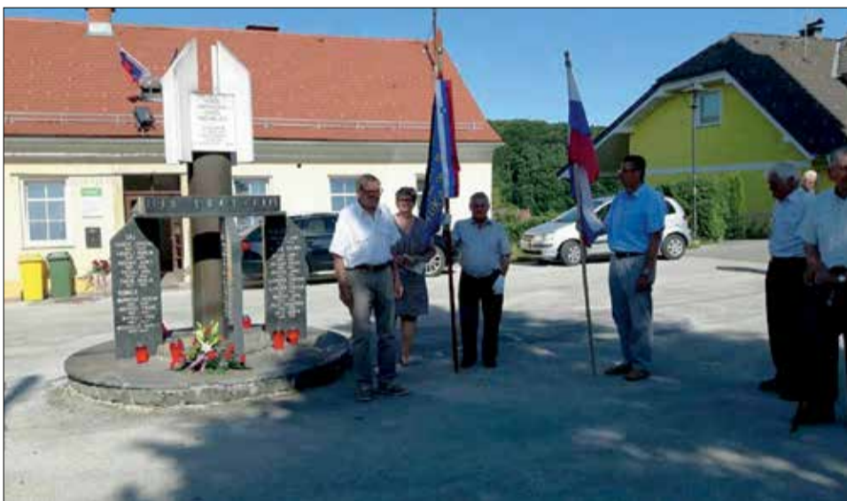
Komemoracija ob dnevu izgnancev na Veliki Dolini