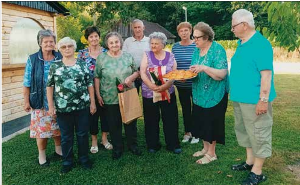
Odbor KO DIS Globoko – Pišece, junij 2021

KO DIS Globoko – Pišece je bilo ustanovljeno v decembru leta 1992. Zanimanje za nastanek društva je bilo takrat zelo veliko, saj je članstvo v DIS prineslo veliko koristi. Kljub temu da od takrat mineva 29 let, je KO DIS v danih okoliščinah še vedno aktivno. Seveda se je od takrat zgodilo mnogo sprememb: mnogo jih je zaradi zakonitosti narave odšlo, pa tudi nekaj novih je prišlo.