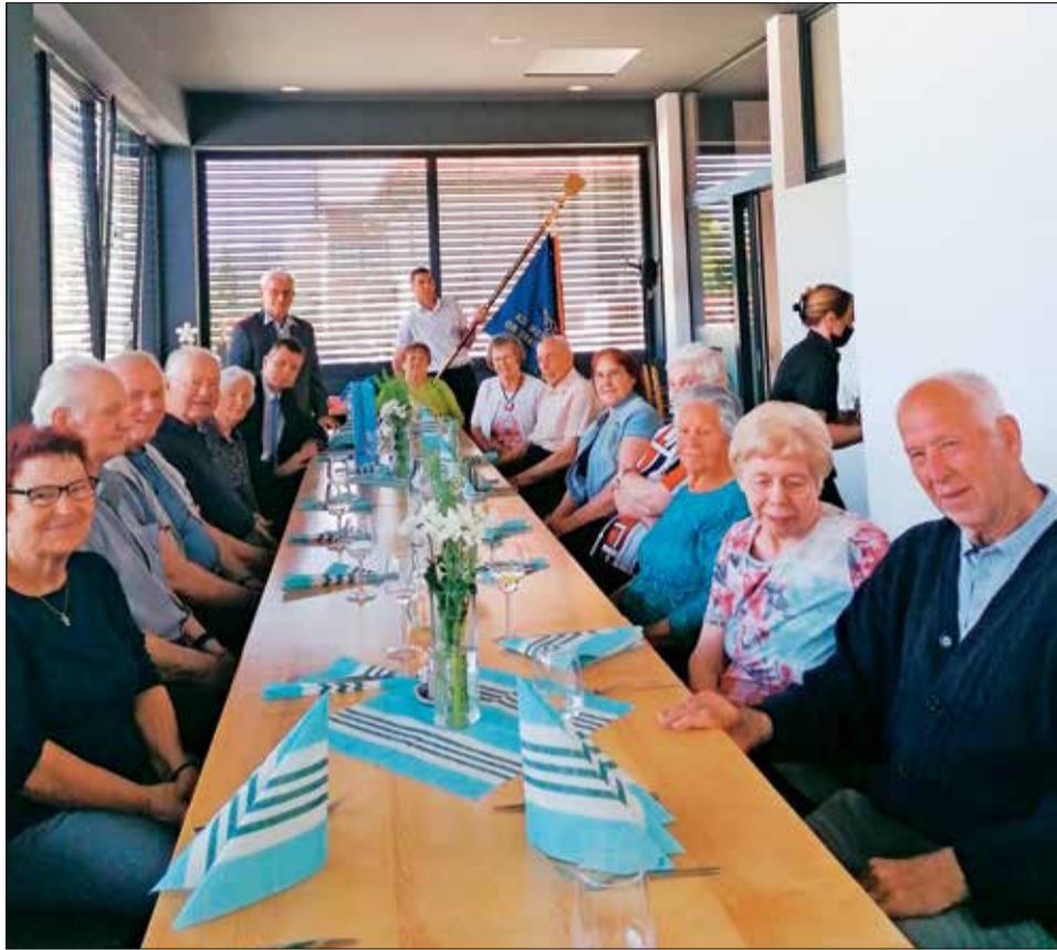
Udeleženci občnega zbora 14. 6. 2021

V občini Radlje ob Dravi smo 14. junija 2021 opravili občni zbor OO DIS 1941–1945 OBČIN MUTA, PODVELKA, RADLJE OB DRAVI, RIBNICA NA POHORJU, VUZENICA ZA LETI 2019 IN 2020.