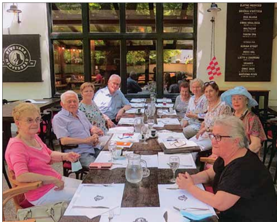
Izgnanci KO DIS Zagreb na letnem občnem zboru (6. 7. 2021)

Člani KO DIS Zagreb smo se letos zbrali 6. julija v pivnici Medvedgrad in proslavili 30. letnico ustanovitve Društva izgnancev Slovenije. Kako hitro je minilo trideset let, ko smo se izgnanci prvič množično zbrali na gradu Rajhenburg, ki je bilo največje taborišče za izgon Slovencev.