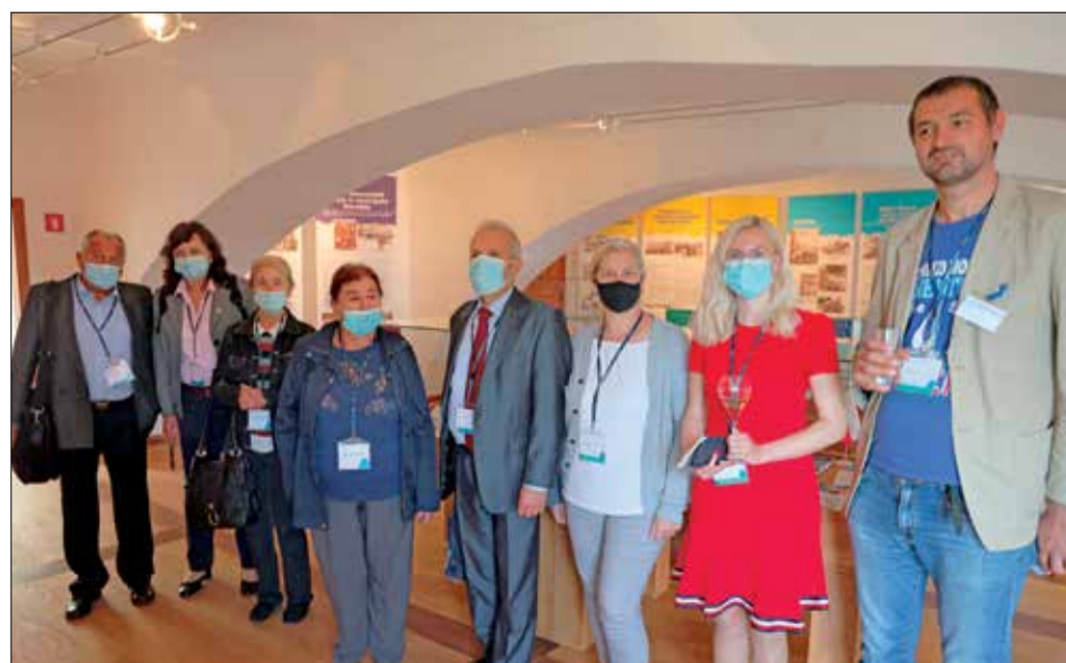
Del udeležencev na ogledu razstave DIS o nasilju nad slovanskimi narodi