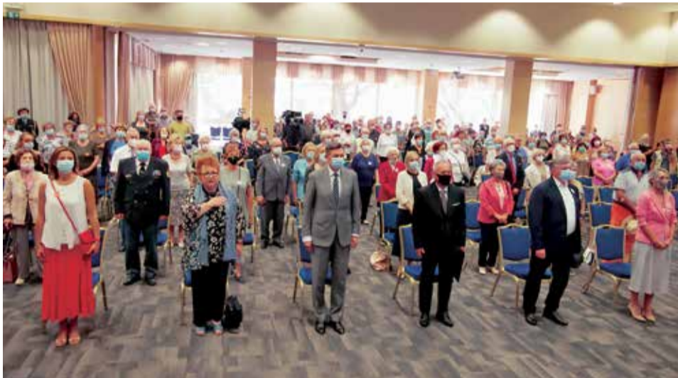
Srečanje nekdanjih internirank in taboriščnic v Portorožu 5. septembra 2021

Pod pokroviteljstvom predsednika Republike Slovenije, gospoda Boruta Pahorja, je bilo 5. septembra 2021 v Portorožu srečanje nekdanjih taboriščnic, političnih zapornic, izgnank in ukradenih otrok. Pri organizaciji srečanja smo sodelovali tudi člani KO DIS z obale.