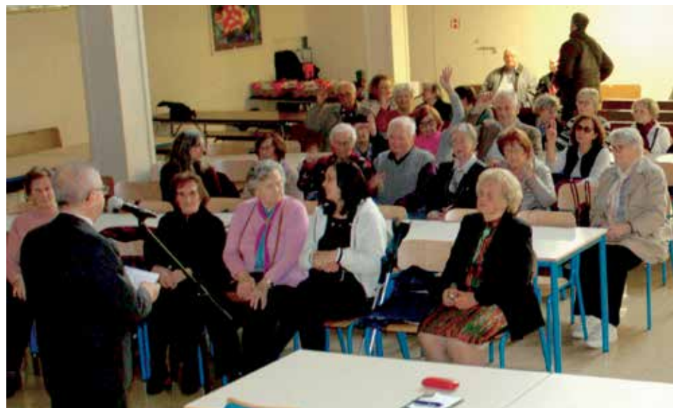
Sestanek v Koprju, 13. aprila 2023.

OO DIS Obala Koper-Izola-Piran in Ankaran je izvedla svoj letni občni zbor 13. aprila 2023 v Osnovni šoli Dušana Bordona v Koprju.