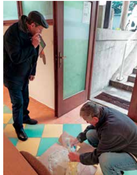
Prostovoljno delo članov društva v pisarni KO DIS Celje.

V zadnjih treh letih smo v prostoru naše pisarne pridobili tekočo vodo in sanitarije, kar je za ene samoumevno, mi pa smo bili vseh 27 let brez tega vsakdanjega udobja. Sedaj pa, ker smo