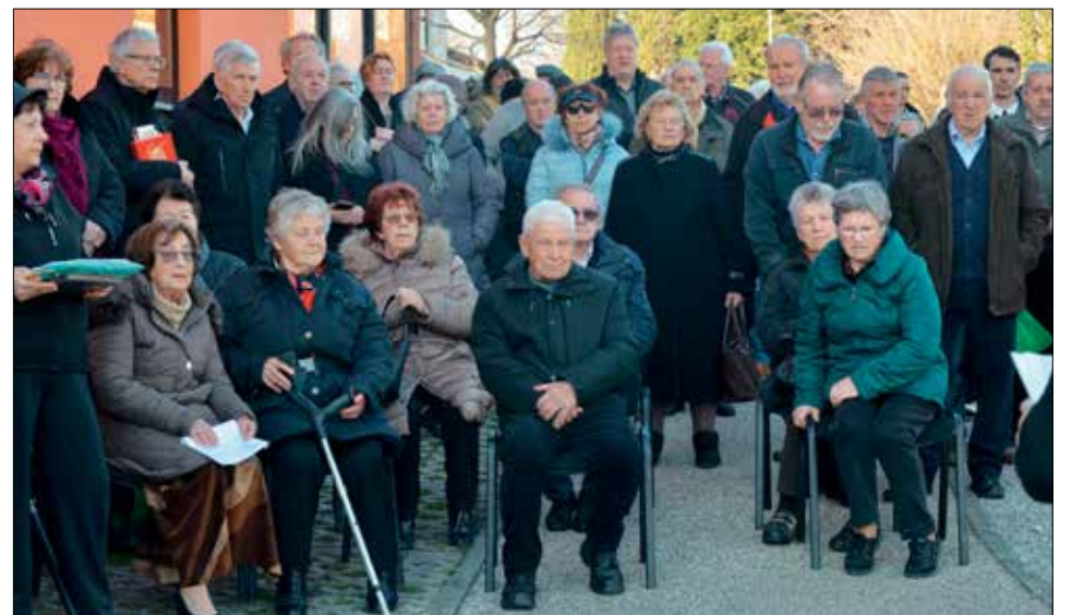
Srečanje z izgnanci KO DIS Komen, 15. 2. 2023.

Delegacija OO DIS Obala je 15. 2. obiskala Komen, ki so ga nemški okupatorji leta 1944 požgali, krajanje pa odpeljali v nemško taborišče na Bavarskem. Občina in KO DIS Komen sta pripravili pester program. Odprla sta tudi Medgeneracijski park, otroško igrišče in ob obstoječem spomeniku izgnancem postavila informacijsko ploščo, ki v sliki in besedi prikazuje ruševine požganih hiš in njihovo obnovo. V kulturnem programu so sodelovali učenci Osnovne šole Antona Šibelja - Stjenka iz Komna. Govorca pa sta