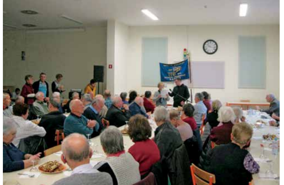
Del udeležencev na sestanku KO DIS Radeče, 10. 12. 2022.