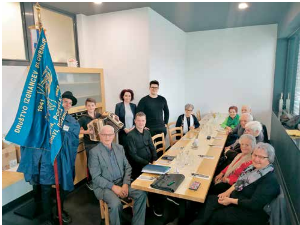
Udeleženci občnega zbora OO DIS, dne 13. april 2023.

V četrtek, 13. aprila 2023, je potekal v prostorih restavracije Marenberg – mestna kavarna v Radljah ob Dravi – letni občni zbor OO DIS 1941–1945 Občin Muta, Podvelka, Radlje ob Dravi, Ribnica na Pohorju, Vuzenica za leto 2022.