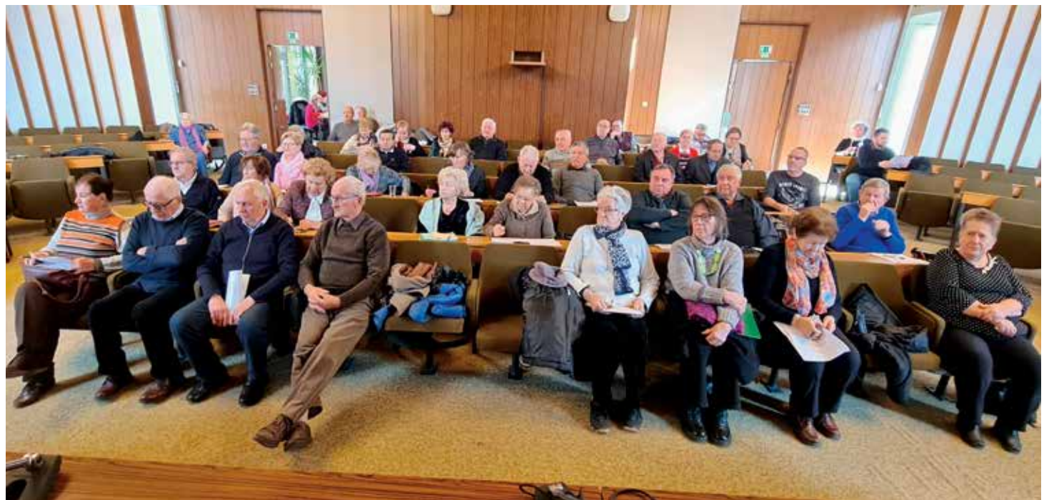
Del udeležencev Skupščine DIS, 11. 2. 2023.