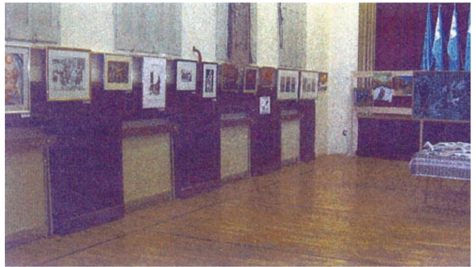
Slikarska razstava v počastitev zmage nad fašizmom in nacizmom v Mošnjah