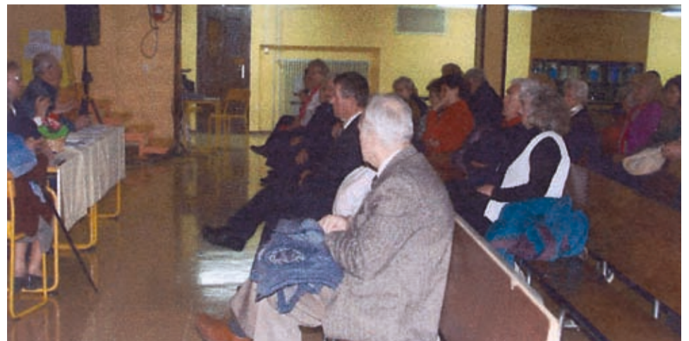
Z letnega občnega zbora KO DIS Obala Koper-Izola-Piran (11. 3. 2010)