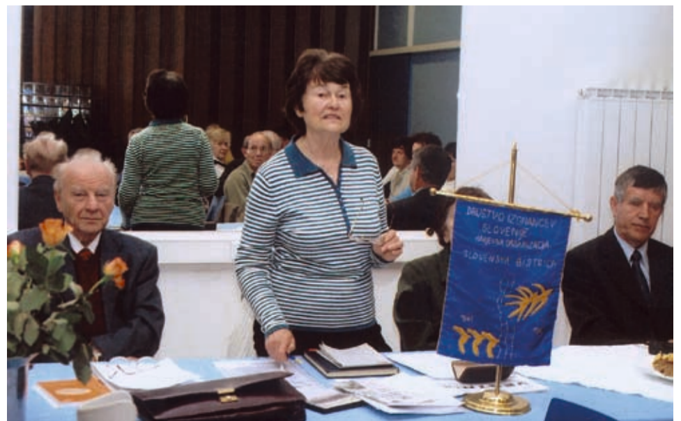
Občni zbor KO DIS Slov. Bistrica (10. 4. 2010)