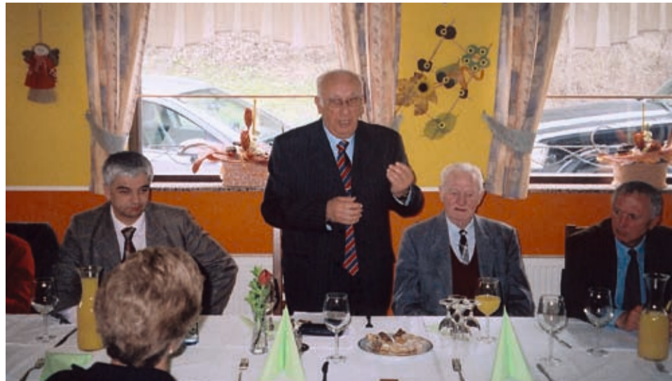
Občni zbor KO DIS Slovenske Konjice (14. 4. 2010)