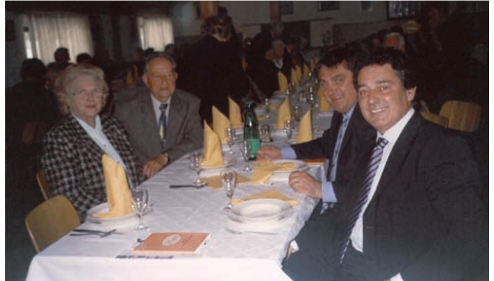
Občni zbor KO DIS Polje ob Sotli-Bučé (24. 4. 2010)

K rajevna organizacija DIS Polje ob Sotli-Bučé, je dne 24. 4. 2010 izvedla letni občni zbor v prostorih Doma krajanov.