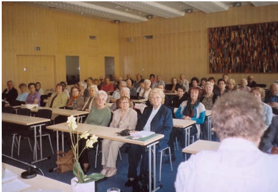
Del udeležencev občnega zboru KO DIS Maribor Tabor (11. 5. 2010)