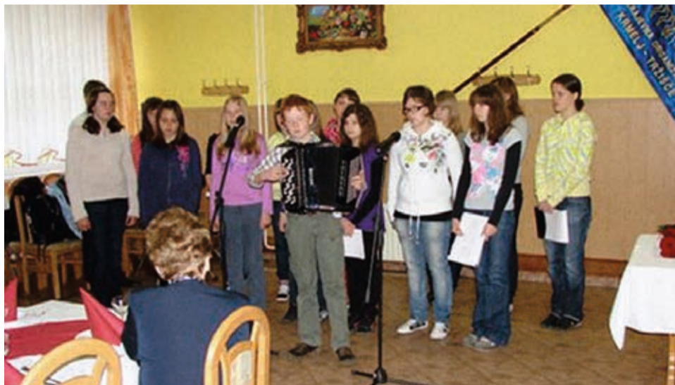
Na občnem zboru KO DIS Krmelj-Tržišče so v kulturnem programu sodelovali tudi učenci OŠ Krmelj.