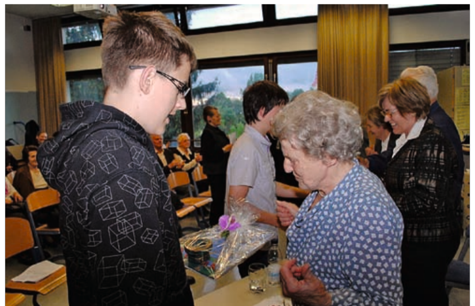
Zgodovinski krožek na OŠ v Mengšu (6. 5. 2010)