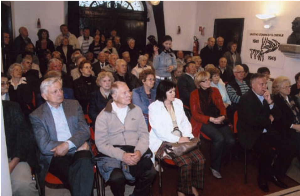
Odprtja razstave v Kosovi graščini na Jesenicah se je udeležilo veliko ljudi.

V Kosovi graščini na Jesenicah je bila 4. maja 2010 odprta razstava pod naslovom Izgnani z domov. Razstavo je pripravilo 6 gorenjskih muzejev,