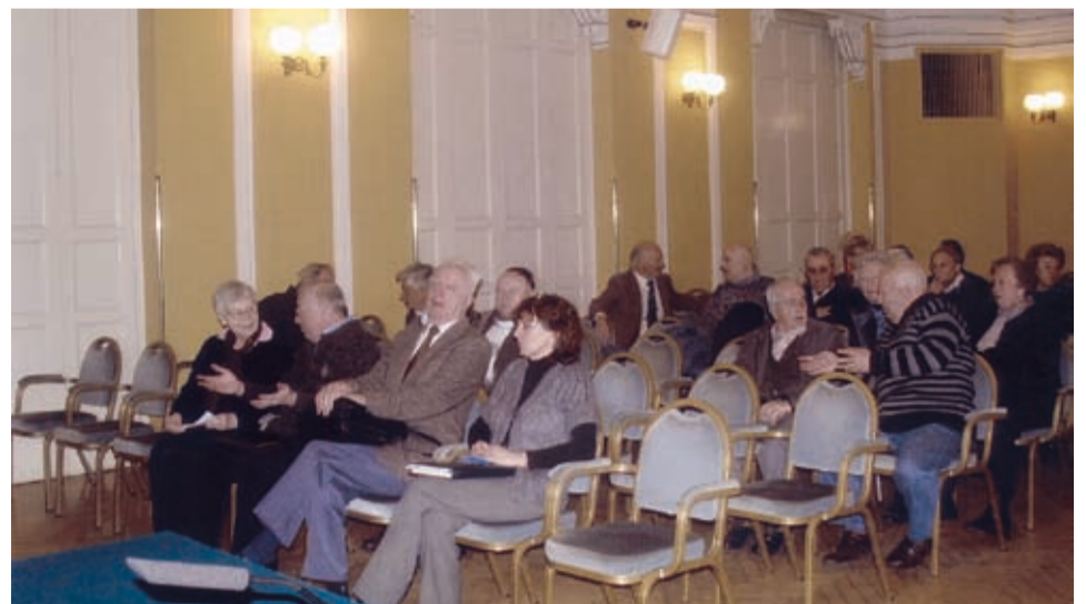
Občni zbor KO DIS Celje (11. 3. 2010)