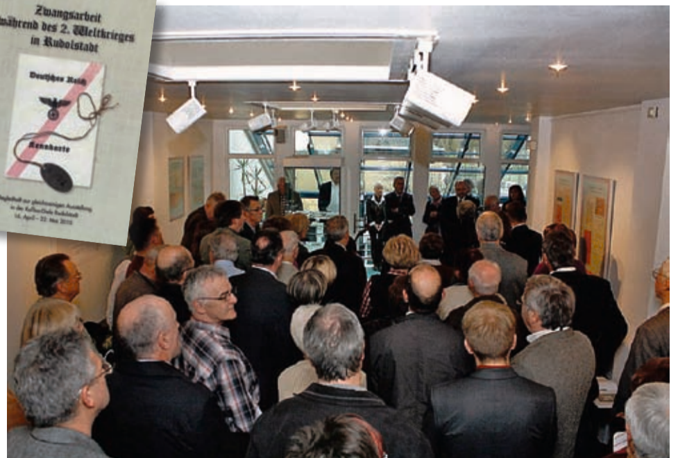
Udeležba na odprtju razstave o prisilnem delu je bila velika (16. 4. 2010)