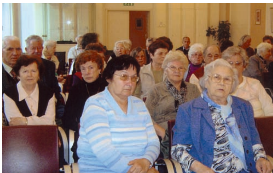
Del udeležencev zbora v Novem mestu (15. 5. 2010)