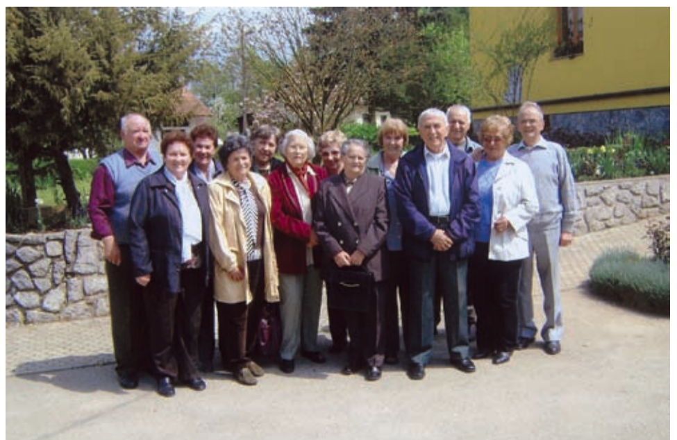
Del udeležencev Območne organizacije Novo mesto na zboru v Krupi.

in pozdravili so ta način dela KO DIS Novo mesto, da je bil zbor blizu njihovega doma.