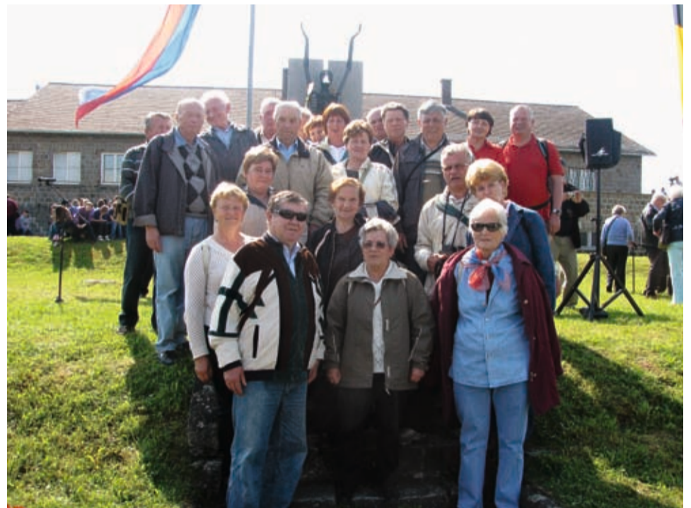
Udeleženci spominske slovesnosti v Mauthausnu (9. 5. 2010)