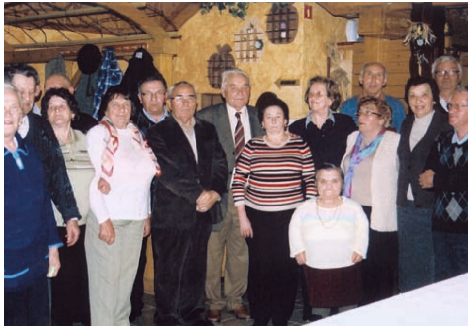
Del udeležencev občnega zbora KO DIS Lenart (26. 3. 2010)