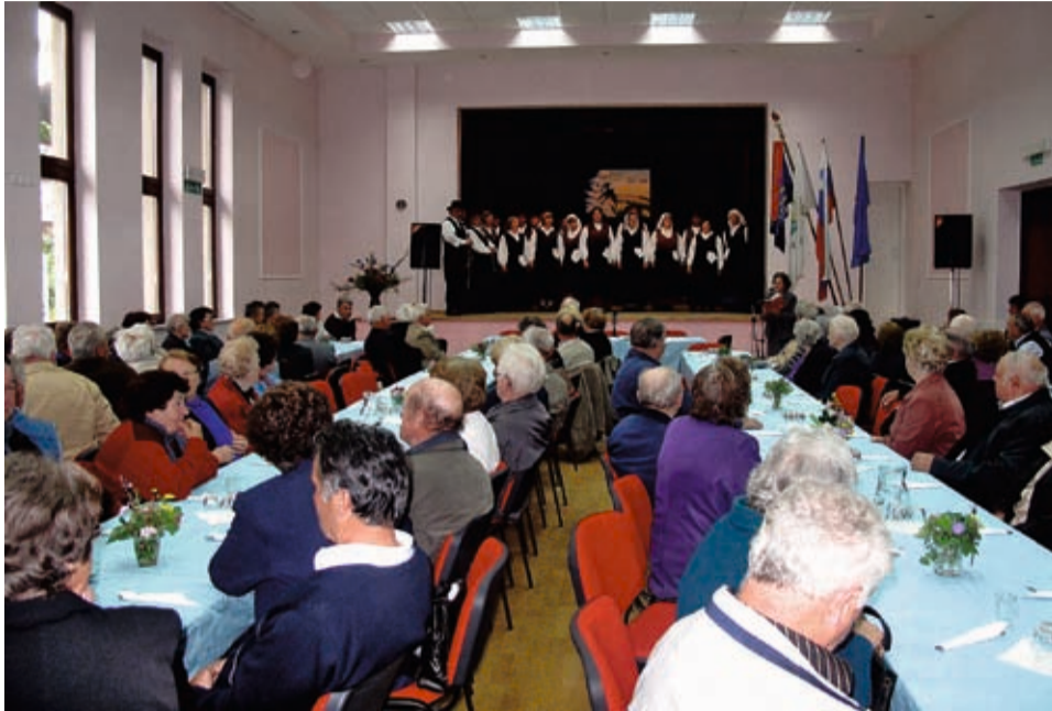
Z občnega zbora KO DIS Boštanj (24. 5. 2010)