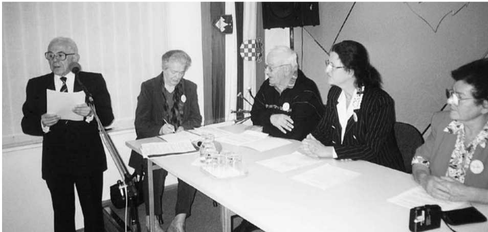
Predsednik KO DIS Zagreb in delovno predsedstvo na občnem zboru KO DIS Zagreb (10. 5. 2005).