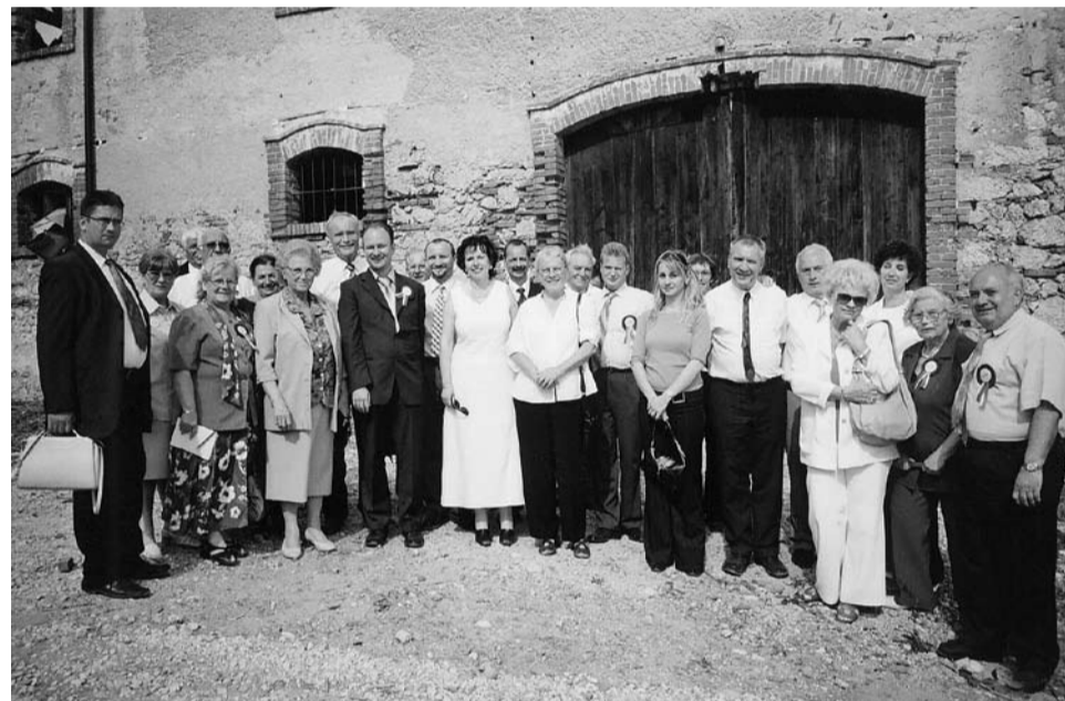
Gostje iz drugih držav so si z zanimanjem ogledali obnovljene strehe zbirnega taborišča za izgon Slovencev (4. 6. 2005).