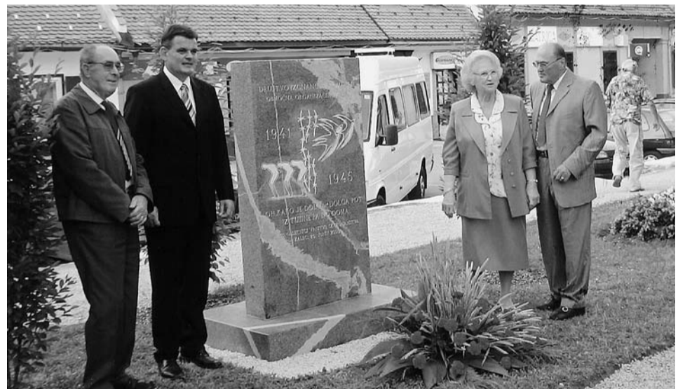
Odkritje spomenika ob 60. obletnici vrnitve iz izgnanstva in begunstva v Žalcu 24. 6. 2005