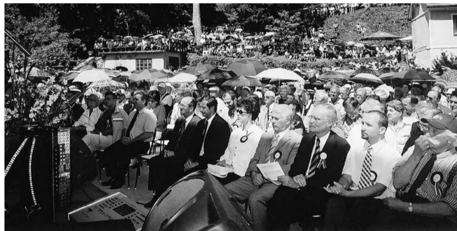
Na osrednji prireditvi ob 60. obletnici vrnitve v domovino pri rajhenburškem gradu, ki jo organiziralo Društvo izgancev Slovenije, se je zbralo več kot 8000 izgancev, beguncev, prisilnih delavcev in drugih žrtev vojnega nasilja.