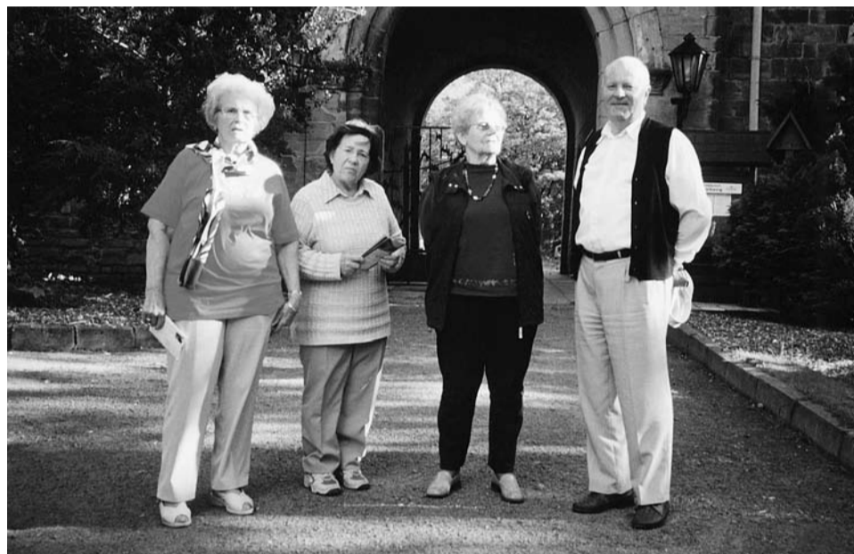
Ilseburg: pred vhodom v grad, kjer je bilo taborišče.

Na poti domov smo obiskali tudi Buchenwald, kjer je bila komanda naših taborišč. Na koncu naj povzamem naše občutje z besedami ene od sopotnic, ki je napisala mnenje vseh nas.