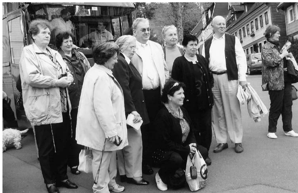
Lautenthal, 24. maja 2005. Župan tega mesta, voditeljica izleta in izgnanci, ki so bili v tem kraju v taborišču.

Lastnikov še niso našli. Prijazna soseda, ki je prej imela ključ, pa je žal umrla. Obiskali smo tudi pokopališče in položili venček DIS-a. Tu je pokopanih veliko slovenskih izgnancev, pokopališče je lepo urejeno. Kljub dežju smo prižgali sveče, položili cvetje in bili v duhu s pokojniki, ki počivajo v tuji zemlji. V hotelu v Kolkwitzu nas je pozdravil župan tega mesta, ki nikoli ne