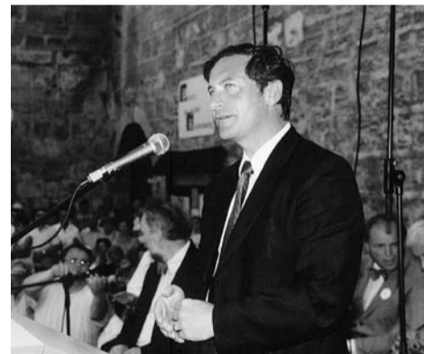
Minister za obrambo Karel Erjavec je kljub številnim obveznostim prišel v Brestanico in pozdravil udeležence osrednje prireditve ob 60. obletnici vrnitve iz izgnanstva in begunstva.

Nacisti so slovenske izgnance izkoriščali kot ceneno delovno silo za najtežja dela. Prisilno so delali tudi otroci, in to v rudnikih, kamnolomih, tovarnah, pri graditvi cest in železnic, na kmetih, dekleta so iz lagerjev pošiljali za deklice k nemškim družinam. Vse o tem pove Göringovo naročilo: »Ne ubiti, naj se na delu mučijo do smrti.« Slabo se je godilo tudi izgnanim v druge kraje nekdanje Jugoslavije, trpeli so tudi pobegli pred izgonom in drugi begunci.