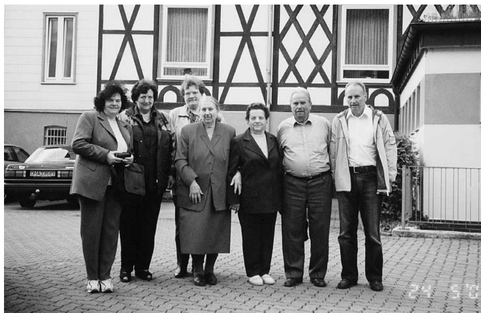
Bad Lauterberg na kraju, kjer je bilo taborišče.

Zelo zgoščen program je dal vsakemu nekaj, tako da smo, čeprav utrujeni, doživeli nepozabne trenutke oživelih spominov na