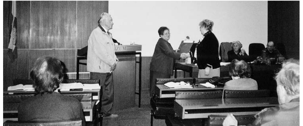
Z občnega zbora KO DIS Maribor Tabor (11. 5. 2005)